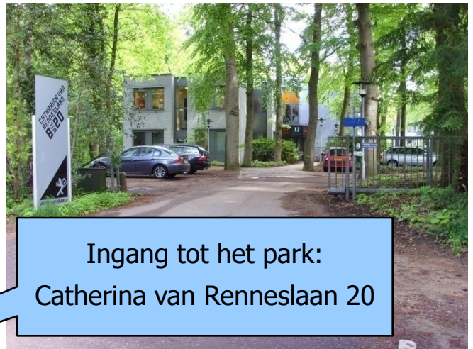
Ingang tot het park: Catherina van Renneslaan 20