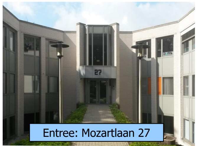
Entree: Mozartlaan 27